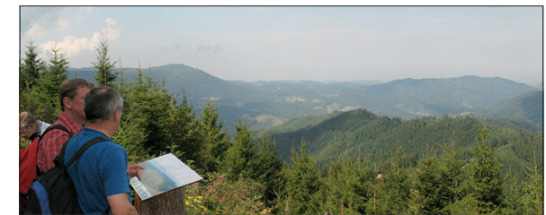
Panorama vom Renchtalblick aus