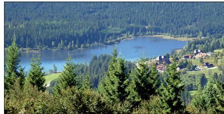
Aha vom Bildsteinfelsen aus